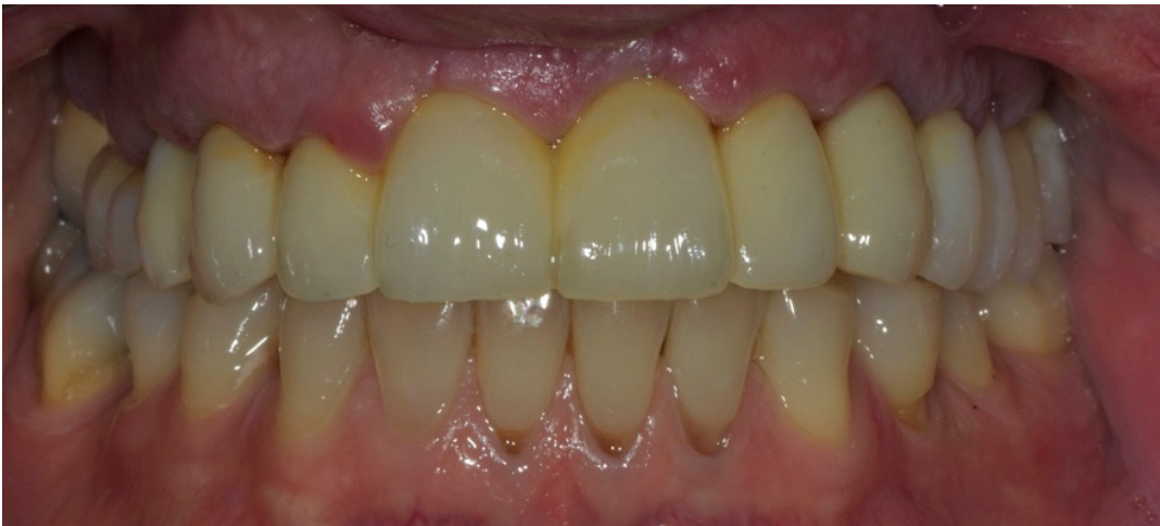
Manufatto in situ: consegna immediata post intervento